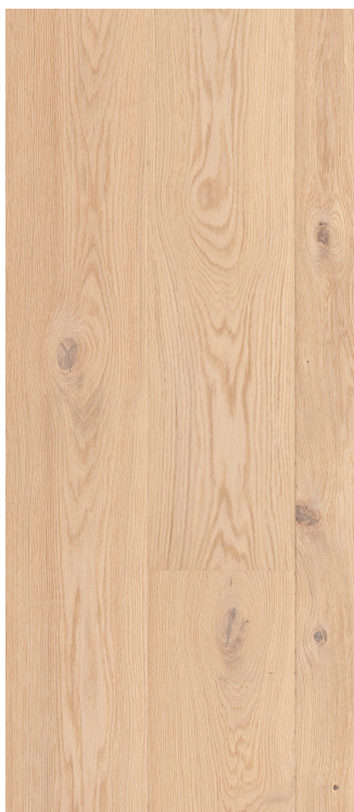
Eg Country børstet hvid Varenr.: 145084s DB nr.: 2313057