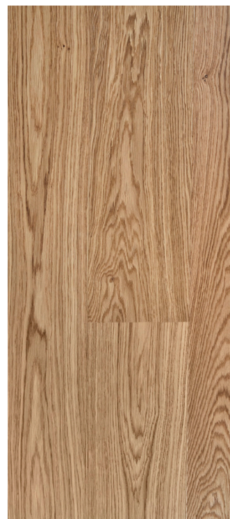
Eg Prime børstet natur Varenr.: 145092ns DB nr.: 2313060