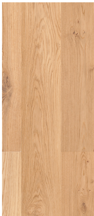
Eg Country børstet natur Varenr.: 145085s DB nr.: 2313058