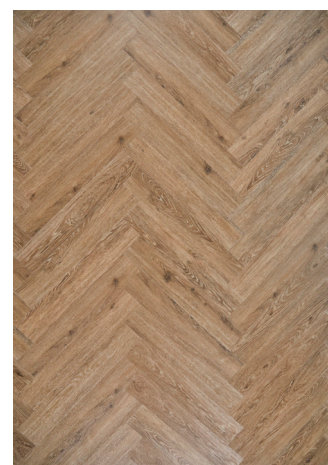
Sildeben Natural Oak Varenr.: 155014a DB nr.: 2406897