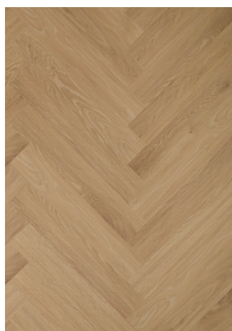
Sildeben Washed Oak Varenr.: 155003a DB nr.: 2377335