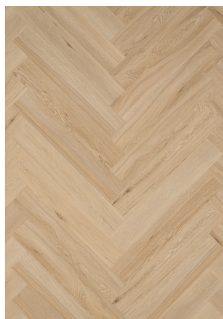
Sildeben Barbados Varenr.: 156044 DB nr.: 22539629