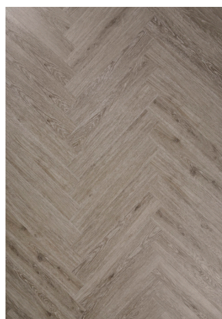
Sildeben Steel Oak Varenr.: 155009a DB nr.: 2406896