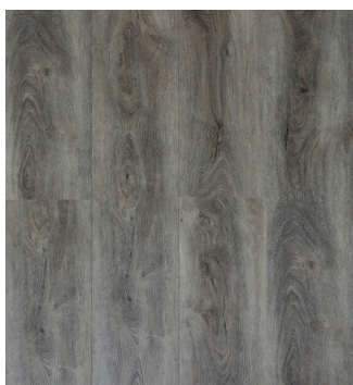
Fashion Oak Varenr.: 155011 DB nr.: 1960374