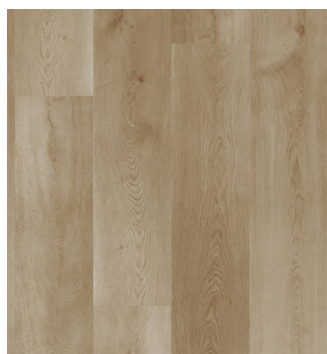
Oregon Oak Varenr.: 155017 DB nr.: 2121003