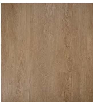
Colorado Oak Varenr.: 155027 DB nr.: 2215645