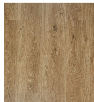
Natural Oak Varenr.: 155026 DB nr.: 1965793