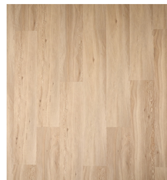
Astoria Oak Varenr.: 155201 DB nr.: 2553091