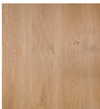
Texas Oak Varenr.: 155028 DB nr.: 2215646