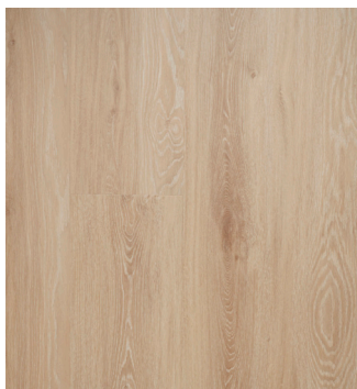
Washed Oak Varenr.: 155033 DB nr.: 2342936