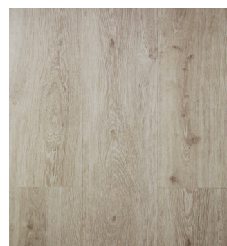
Urban Grey Oak Varenr.: 155032 DB nr.: 1988014