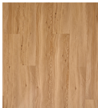
Olympia Oak Varenr.: 155200 DB nr.: 2553090