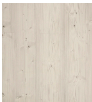
Kalmar Varenr.: 155029 DB nr.: 2305949