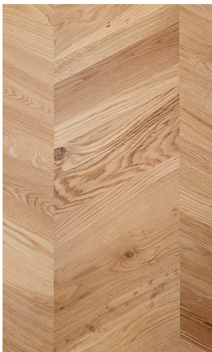
Eg Chevron natur Varenr.: 146008r DB nr.: 2266897